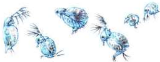
Ветвистоусые рачки — обитатели пресных водоемов.

28. Какой способ добывания пищи у организмов изображенных на рисунке.